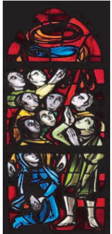
Himmelfahrt: Glasbild von Hans Stockhausen.

Himmelfahrt fand schon früh Eingang in die christlichen Bekenntnisse: „... aufgefahen in den Himmel, er sitzt zur Rechten des Vaters“, heißt es im Glaubensbekenntnis . Für uns bedeutet das: Da Gott unser guter und liebender, ein mütterlicher Vater ist, sollen wir für unsere Kinder auch ein guter Vater – oder eine gute Mutter – sein und unseren Kindern den Platz geben, der ihnen gebührt. Wenn Eltern auch am Himmelfahrtstag daran denken, dann ist Himmelfahrt zugleich Vätertag.