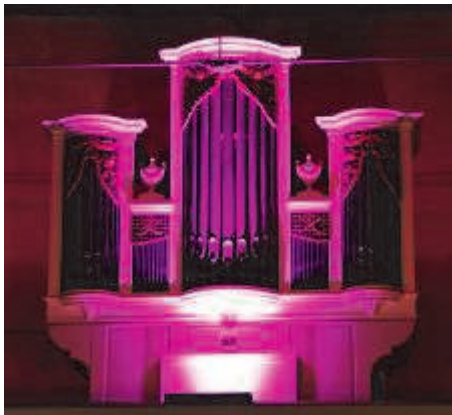
Spielte musikalisch an diesem Abend keine Rolle, machte aber durch die Illumination optisch Eindruck: Die Westuffeler Orgel.

Neben eigenen Songs kamen auch Stücke international bekannter Künstler von Chris de Burgh über Milow bis hin zu Cyndi Lauper zur Aufführung und begeisterten die Konzertbesucher.